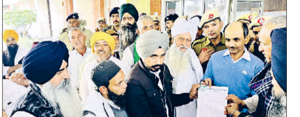
जौड़। मांगों को लेकर एसडीएम को ज्ञापन सौंपते किसान नेता।

एमएसपी पर फसलों की खरीद व किसानों, मजदूरों की संपूर्ण कर्जा माफी को लेकर हरियाणा किसान, मजदूर संघर्ष मांच के किसान नेताओं ने जाट धर्मशाला में हुई बैठक में सर्वसम्मति से निर्णय लेकर संघर्ष का बिगुल बजा दिया है। पूरे हरियाणा में कर्ज माफी व फसलों के पूरे दाम के लिए मोर्चा यात्राओं के माध्यम से किसानों मजदूरों को एकजुट करके अपनी मांगों को लेकर 23, 24 और 25 फरवरी 2026 को कुरुक्षेत्र में मुख्यमंत्री आवास पर किसानों मजदूरों व आमजन का जमावड़ा होगा। हरियाणा किसान मजदूर संघर्ष