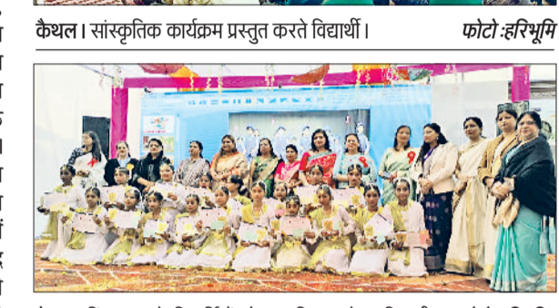
कैथल। सांस्कृतिक कार्यक्रम प्रस्तुत करते विद्यार्थी।