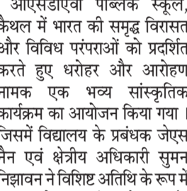
हरिभूमि न्यूज कैथल

नृत्य बहुत ही मनोहर तथा रोचक ढंग से प्रस्तुत किया