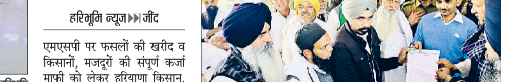
हरिभूमि न्यूज जौड़

23, 24, 25 फरवरी को कुरुक्षेत्र में मुख्यमंत्री आवास पर होगा