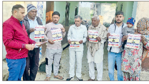
जौड़। ग्रामीणों को टीबी बीमारी को लेकर जागरूक करते स्वास्थ्यकर्मी।