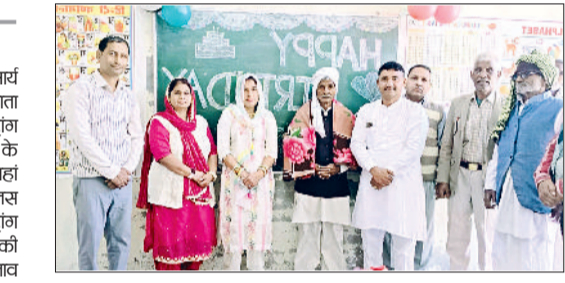
जुलाना। महिलाओं को चुंदड़ी भेट करती पंचायत समिति सदस्य।