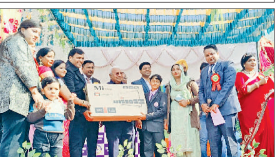
कैथल। प्रदर्शनी में अवल रहे विद्यार्थियों को सम्मानित करते पदाधिकारी।