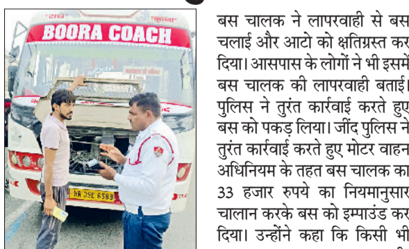
जीद। कार्रवाई करते हुए ट्रैफिक पुलिसकर्मी।