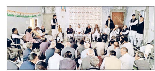
जौड़। बैठक में भाग लेते हुए कार्यकर्ता।