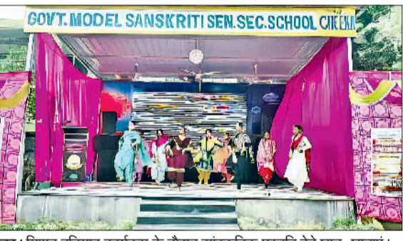
चौका। मिशन बुनियाद कार्यक्रम के दौरान सांस्कृतिक प्रस्तुति देते छात्र-छात्राएं।