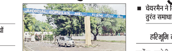
जीद। अदालत परिसर।

जिला न्यायालय परिसर सहित उपमंडल स्तर पर शनिवार को राष्ट्रीय लोक अदालत का आयोजन होने जा रहा है। इस अदालत में 10200 लंबित मामले रखे जाएंगे। इनमें जीद में 9707, नरवाना में 333 और सफीदों में 248 मामलों की सुनवाई होगी। इनमें पारिवारिक, बैंक और सिविल सहित अन्य मुकदमों की सुनवाई होगी। राष्ट्रीय लोक अदालत में आम नागरिक आपसी सुलह और समझौते के आधार पर स्वयं या अपने अधिवक्ता के